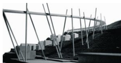
... spielerisch ...

Um unser Budget weiter zu entlasten freuen wir uns, wenn wir euch in Zukunft die Länggenossin elektronisch zustellen dürfen. Bitte Mail an info@sp-lf.ch