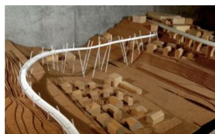
Weitere Gestaltungsideen* ...